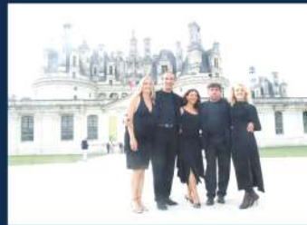
Chambord en fête