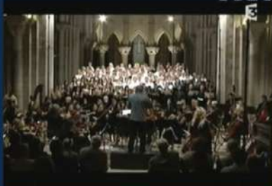
Basilique de Vézelay